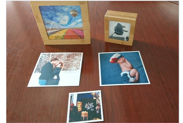
圖 4. 照片 (2)