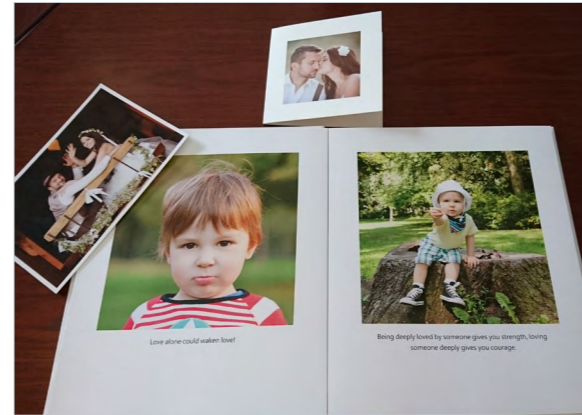
圖 3. 照片 (1)